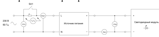
Figure 1 Рис. 1 Схема экспериментальной установки для исследования гармонического состава тока потребления ИП и СМ.