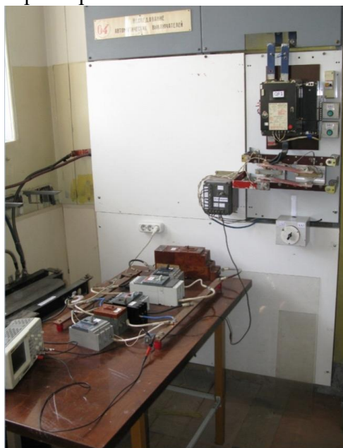
Figure 1 Рисунок 1. Общий вид стенда по исследованию автоматических выключателей

Установка, приведенная на рисунок 1, питается от печного трансформатора 220/49,6В/В мощностью 100кВА, 450А первичного тока и 2кА длительного тока вторичной нагрузки. При закорачивании вторичной обмотки в течение одного полупериода испытуемым автоматическим выключателем вторичный ток может достигать 12кА. Ввод питания осуществляется шинами, приходящие на вводный автоматический выключатель QF1 с моторным приводом от независимого мощного первичного трансформаторного источника. Кнопки SB1 и SB2 предназначены для управления моторным приводом автоматического выключателя QF1. При выполнении испытаний регулирование тока осуществляется изменением угла открытия тиристорного блока VS в первичной цепи питания трансформатора посредством переключателя SA1, изменяющего угол открытия тиристора.