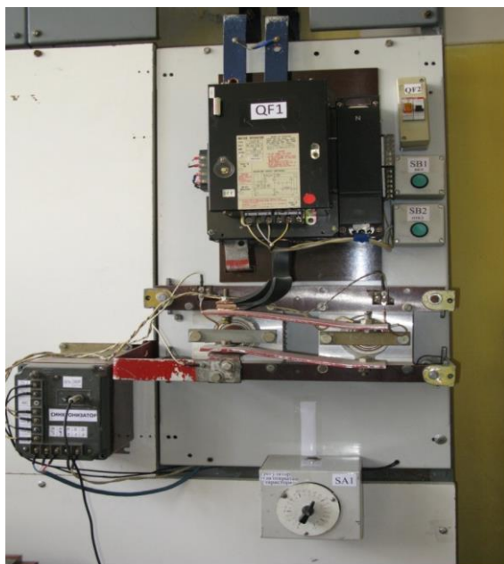
Figure 2 Рисунок 2. Вводной автомат QF1 с системой управления

QF2 автомат питания системы управления, кнопки SB1 «Включение», SB2 «Отключение» моторного привода QF1, блок управления тиристором SA1 с кнопкой включения проведения опытом SB3, расположен на верхней крышке корпуса переключателя SA1 и синхронизатором