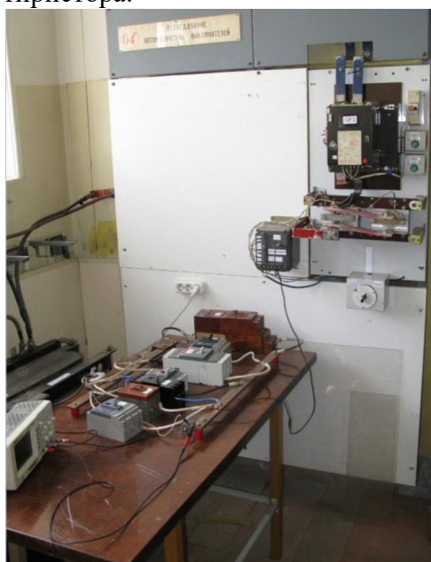
Figure 1 Рисунок 1. Общий вид стенда по исследованию автоматических выключателей

Установка, приведенная на рисунок 1, питается от печного трансформатора 220/49,6В/В мощностью 100кВА, 450А первичного тока и 2кА длительного тока вторичной нагрузки. При закорачивании вторичной обмотки в течение одного полупериода испытуемым автоматическим выключателем вторичный ток может достигать 12кА. Ввод питания осуществляется шинами, приходящие на вводный автоматический выключатель QF1 с моторным приводом от независимого мощного первичного трансформаторного источника. Кнопки SB1 и SB2 предназначены для управления моторным приводом автоматического выключателя QF1. При выполнении испытаний регулирование тока осуществляется изменением угла открытия тиристорного блока VS в первичной цепи питания трансформатора посредством переключателя SA1, изменяющего угол открытия тиристора.