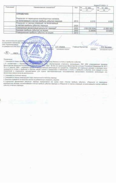
Figure 5 Рисунок 5 - Отчет о финансовых результатах за 2017г., часть 2

2. Проанализировать финансовое состояние выбранного предприятия по данным бухгалтерской отчетности. Предприятие выбирается студентом самостоятельно и согласовывается с преподавателем либо необходимая отчетность для выполнения анализа выдается студенту преподавателем. Предприятие должно быть производственным. В качестве анализируемого периода принимается календарный год. По каждому разделу работы делаются выводы по полученным результатам. В заключении работы делается общий вывод о финансовом состоянии предприятия по итогам проведенного комплексного анализа и предлагаются мероприятия по улучшению его финансового состояния.