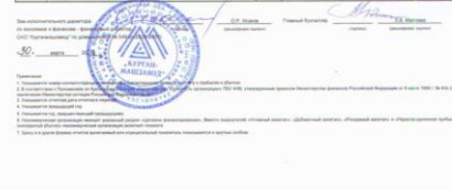
Figure 8 Рисунок 3 - Бухгалтерский баланс на 31.12.17г., часть 3