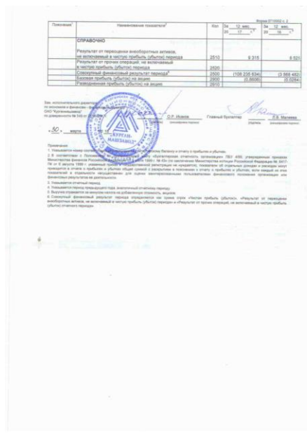
Figure 5 Рисунок 5 - Отчет о финансовых результатах за 2017г., часть 2

2. Проанализировать финансовое состояние выбранного предприятия по данным бухгалтерской отчетности. Предприятие выбирается студентом самостоятельно и согласовывается с преподавателем либо необходимая отчетность для выполнения анализа выдается студенту преподавателем. Предприятие должно быть производственным. В качестве анализируемого периода принимается календарный год. По каждому разделу работы делаются выводы по полученным результатам. В заключении работы делается общий вывод о финансовом состоянии предприятия по итогам проведенного комплексного анализа и предлагаются мероприятия по улучшению его финансового состояния.