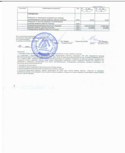
Figure 5 Рисунок 5 - Отчет о финансовых результатах за 2017г., часть 2

Уметь: проанализировать финансовые результаты и эффективность финансово-хозяйственной деятельности предприятия