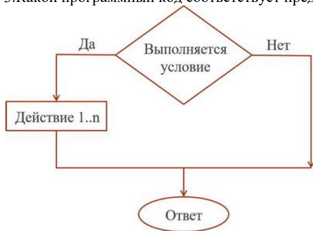
Figure 3 Рисунок 1

3. Какой программный код соответствует представленной блок-схеме рисунок 1